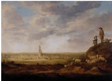
Albert Cuyp Ansicht von Amersfoort, vermutl. vor 1650 Von der Heydt-Museum Wuppertal

Goldene Zeiten Die Sammlung Niederländischer Kunst und ihre Geschichte 28. Februar 2021 – 27. Februar 2022