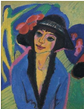
Ernst-Ludwig Kirchner Bildnis Gerda, 1914 Von der Heydt-Museum Wuppertal

Die Ausstellung geht hervor aus einer engen Zusammenarbeit des Von der Heydt-Museums Wuppertal mit dem Buchheim Museum der Phantasie, Bernried am Starnberger See, und den Kunstsammlungen Chemnitz.