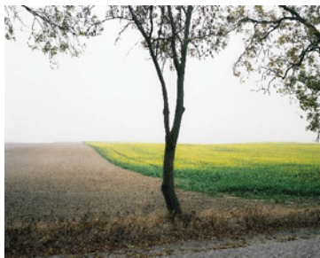
Hans-Christian Schink Zwischen Lemmersdorf und Kleisthöhe, 2016 aus der Serie „Hinterland“

Hans-Christian Schink (Freundschaftsanfrage 1) 28. März 2021 – 15. August 2021