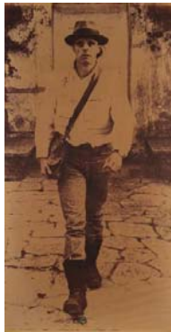
Joseph Beuys La rivoluzione siamo Noi, 1972 Lichtdruck auf Polyesterfolie Von der Heydt-Museum Wuppertal

Anknüpfend an das „24-Stunden-Happening“, das 1965 in der Galerie Parnass in Wuppertal stattfand, präsentiert die Ausstellung Fotografien von Ute Klophaus (1940-2010), in denen die Aktionen von Joseph Beuys (1921-1986) festgehalten sind. Ihre Arbeiten zeigen aus dem Fluss der Zeit „herausgerissene Momente“ der performativen Kunst von Beuys und vermitteln zugleich die besondere Ausstrahlung, Intensität und Energie des Akteurs der Handlung.