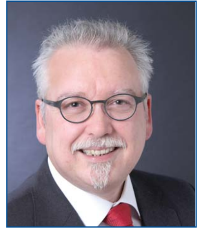
1. Vize Governor Peter R. Fricke