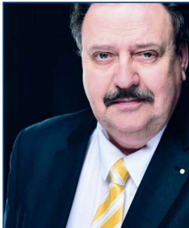
KLEO/KJ Uwe Maedchen