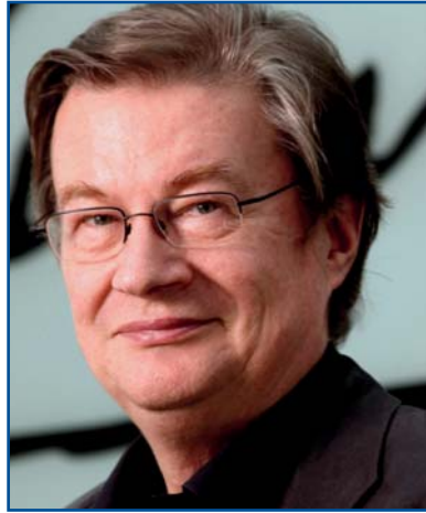
IPD Governor Ulrich Hennig