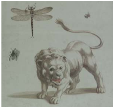
Peter Schenck, Religiöse Darstellung, Löwe und Insekten Farbstich (Ausschnitt) Von der Heydt-Museum Wuppertal

Peter Schenck (ca. 1660-1718) gilt als der Erfinder des Farbstiches. Die Kunstgeschichtsschreibung zählt ihn zwar zu den Niederländern, doch geboren wurde er in (Wuppertal-) Elberfeld. Im 17./18. Jahrhundert, einer Zeit, die als Hochblüte europäischer Bildkunst gilt, erzielte er beachtliche kommerzielle Erfolge als Druckgrafiker, Verleger und Hofgraveur von König August dem Starken von Sachsen-Polen. Bis auf einige wenige Beiträge in der Fachliteratur ist Schenck in den vergangenen Jahrhunderten jedoch beinahe in Vergessenheit geraten. Die Ausstellung des Von der Heydt-Museums rückt diesen bislang wenig beachteten Künstler erstmals wieder ins Rampenlicht. Das Museum verfügt über ein ansehnliches Konvolut druckgraphischer Werke von Schenck, die es nun erstmalig im Rahmen einer Ausstellung zeigt. Die Sonderschau mit seinen faszinierenden Grafiken soll nicht nur die thematische Vielseitigkeit und Könnerschaft des Künstlers ausweisen, sondern auch ästhetische und technische Fragen beleuchten. Im Dialog mit den Grafiken von Schenck präsentiert die Schau Werke seiner Zeitgenossen, um die Bedeutung dieses Elberfelders angemessen zu würdigen.