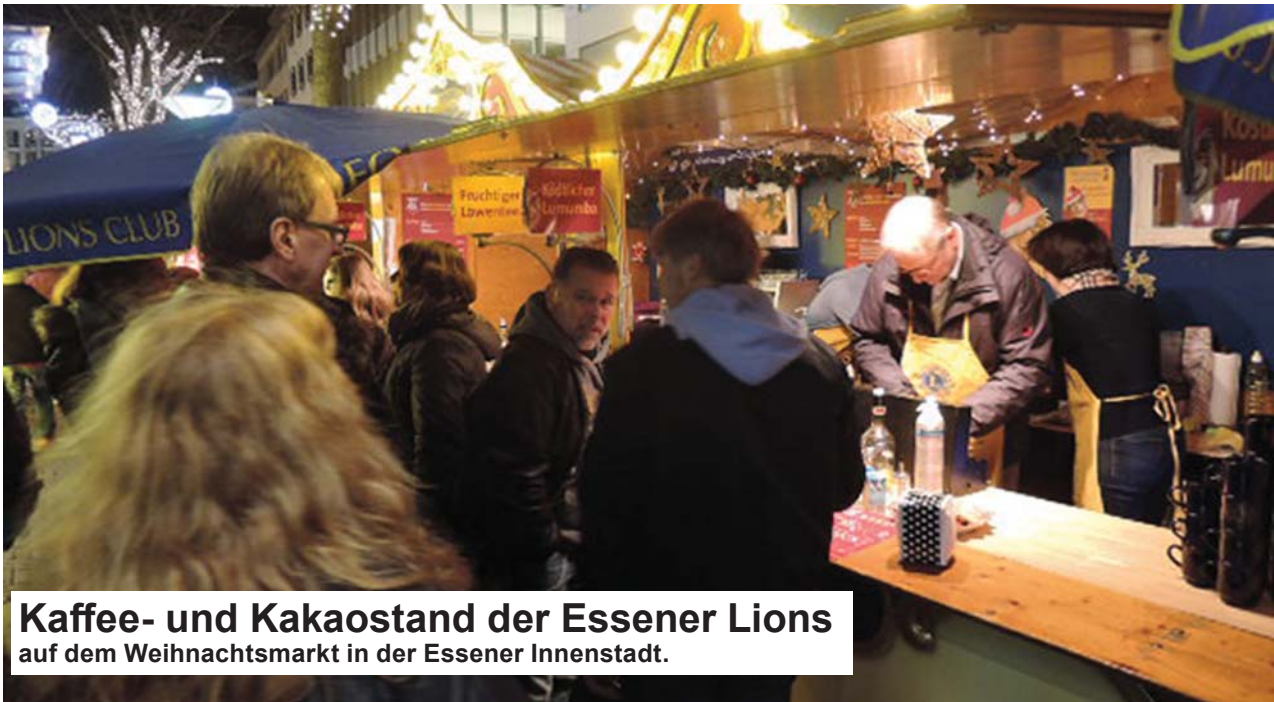
Kaffee- und Kakaostand der Essener Lions auf dem Weihnachtsmarkt in der Essener Innenstadt.

Noch bis zum 23.12.2018 sind die Essener Lions und Leos wieder mit einem Kaffee- und Kakaostand auf dem Weihnachtsmarkt in Essen vertreten. Seit dem Jahr 2010 sind die Leos und Lions hier jedes Jahr vertreten. Die drei Essener Lions-Clubs Assindia, Cosmas & Damian und Ludgerus, sowie der Leo-Club Essen Zollverein, sind dieses Jahr somit das neunte Mal auf dem Weihnachtsmarkt Essen in der Rathenaustraße, vor dem Eingang in die Theaterpassage, präsent. Der fair gehandelte Kakao wird mit Bio-Milch zubereitet und meistens zu-