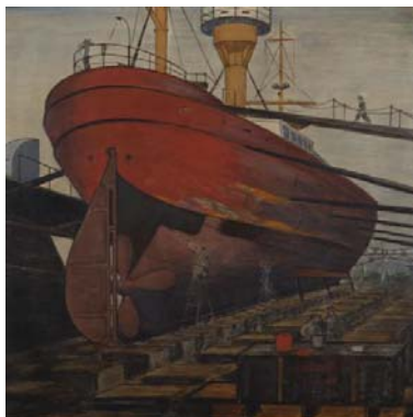
Oskar Schlemmer, Feuerschiff im Trockendock, 1941 Von der Heydt-Museum Wuppertal

Oskar Schlemmer (1888-1943) war einer der bedeutendsten und einflussreichsten Künstler des 20. Jahrhunderts. Vielseitig wie kaum ein anderer war er als Maler, Wandgestalter, Graphiker, Bildhauer und Bühnenbildner tätig. Intensiv setzte er sich mit den Künstlern und Kunstströmungen seiner Zeit auseinander und hinterließ eine große Gruppe an Bewunderern. Das Von der Heydt-Museum widmet Schlemmer eine umfassende Ausstellung, die Werke aus allen Schaffensphasen umfasst. Sie legt einen Fokus weniger auf die Jahre am Bauhaus als vielmehr auf die Spätphase mit seinen ausgereiften Werken und setzt das Werk Schlemmers in Relation zum dem seiner Lehrer, seiner Kollegen am Bauhaus und in Breslau und vor allem auch zu Willi Baumeister und Franz Krause. Nach Stationen am Bauhaus in Dessau und an der Kunstgewerbeschule in Breslau wurde er 1932 von den Nationalsozialisten aus allen Ämtern entlassen und seine Kunst als entartet verfemt. Als „Professor für maltechnische Forschungsvorhaben“ kam er in die Wuppertaler Lackfabrik von Dr. Kurt Herberts. So verbrachte er seine letzten Jahre in Wuppertal und entwarf hier nicht nur sein berühmtes „Lackkabinett“, sondern auch sein „Lackballett“.