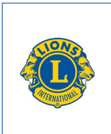
Reg 3 Z1 Sabine Künzel