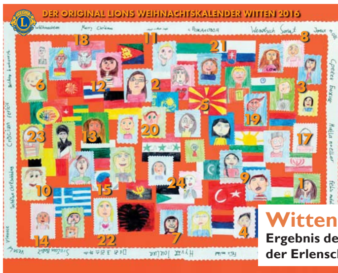
Witten, eine Stadt, viele Gesichter: Ergebnis der Kunstaktion der Schüler der 4. Klassen der Erlenschule